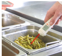
Misura a infrarossi