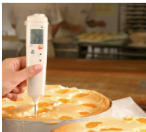
Misura a penetrazione