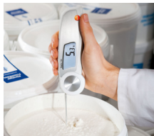
Misura a penetrazione