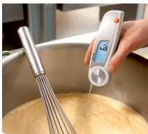
Misura della temperatura nell'impasto