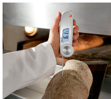
Misura a penetrazione della temperatura