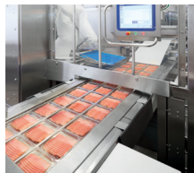
Controllo costante della temperatura durante la produzione